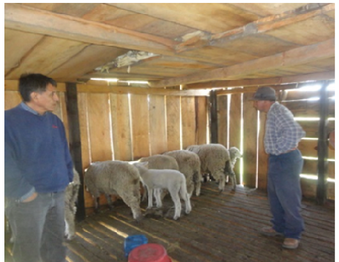
..... Vista interior de un aprisco en la Comunidad de Pacapox. .....

Como resultado del proyecto, hay cinco familias involucradas con apriscos individuales y la réplica del proyecto en seis familias de otras comunidades con un promedio de siete integrantes del núcleo familiar. Indirectamente hay 20% de la población que se beneficia de la compra de estiércol, que aunque no se procesa en aboneras, tiene un costo similar a la gallinaza, que es la más común en la producción de granos básicos en el área, que tiene un costo de Q.25.00 por costal de un quintal de capacidad.