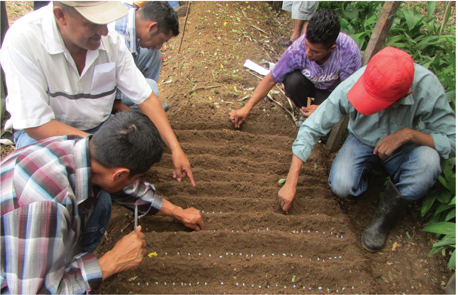
Capacitación para la el manejo y siembra de semilla de Xate Cola de Pescado en la comunidad de Loma Linda del municipio de El Palmar.