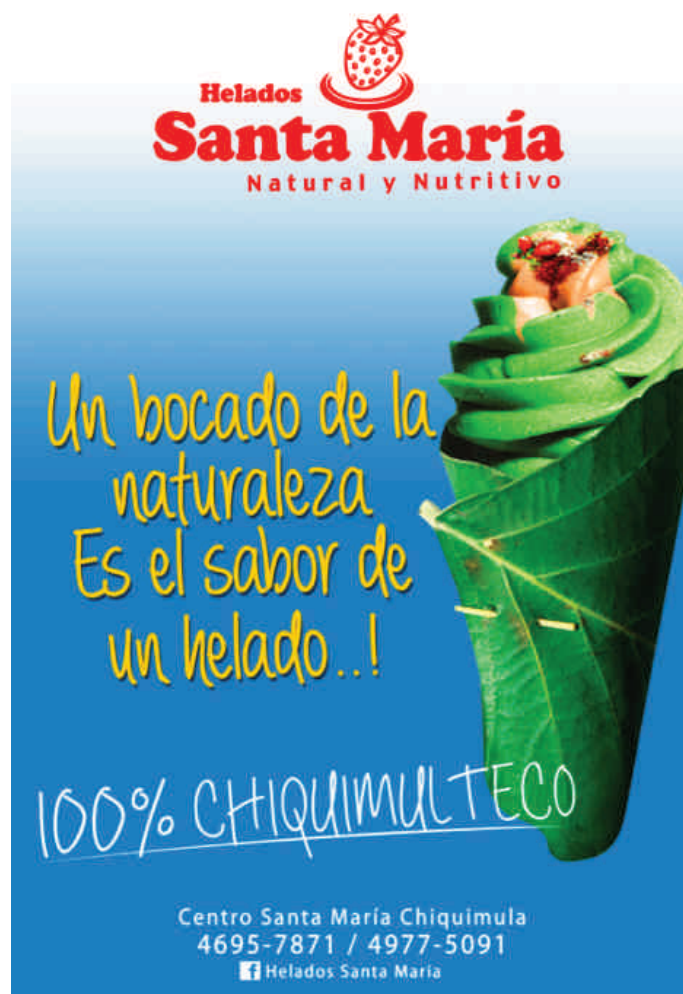
Afiche promocional de "Helados Santa María".

Los beneficios que la experiencia está generando directamente a las familias involucradas, es porque se les compra la producción a un precio justo, entendiendo con ello, que es mejor que lo reciben en el mercado local, por ejemplo: En el mercado se paga Q 1.00 por la libra de mora y la empresa paga Q 2.50.