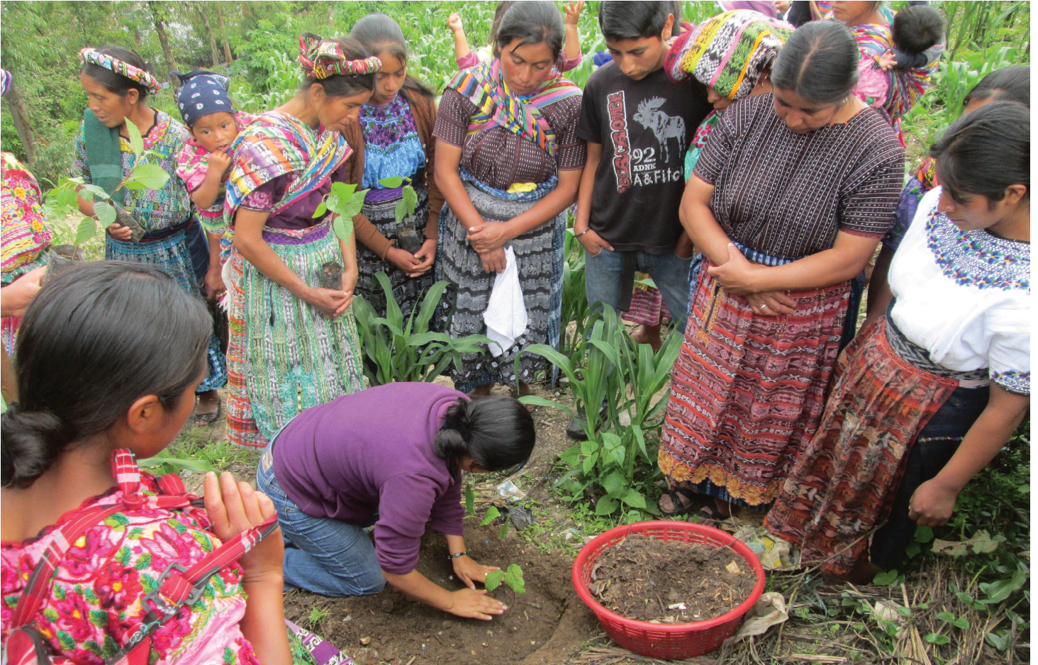
Prácticas de reforestación de aliso en el marco de la implementación del proyecto de bosques energéticos en el municipio de San Miguel Sigüilá.