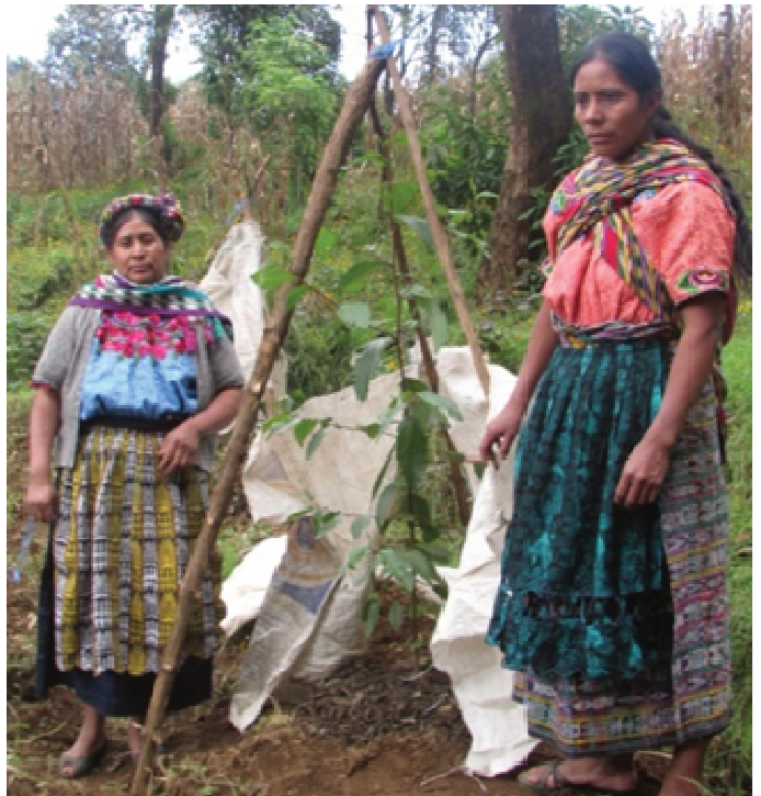
Construcción de estructuras para la protección de árboles contra heladas en el municipio de San Miguel Sigüilá, Quetzaltenango.

Llegar finalmente a la implementación de un proyecto productivo, implicó también una serie de etapas, que iniciaban con la identificación de las posibilidades de inversión que planteaban los actores locales en forma de perfiles de proyectos. Se logró tener un total de 200 perfiles de proyectos, de los cuales 20 eran ideas de proyectos; y de éstos se formularon 15 estudios de prefactibilidad y 10 planes de negocio. Finalmente, se implementaron 10 proyectos productivos.