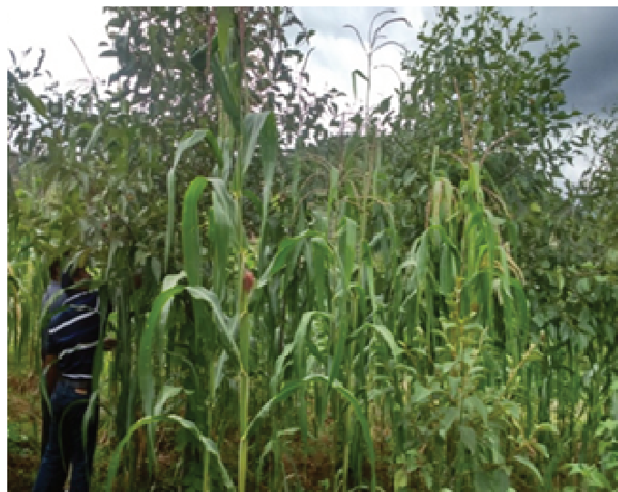
..... Sistemas agroforestales de aliso con maíz en el municipio de Santa María Chiquimula. .....

De acuerdo a la opinión de los entrevistados, consideran que entre tres y cinco años habrá más aljibes, más área de sistemas agroforestales, bosques para leña y principalmente más familias involucradas, pues este proyecto realmente contribuye a mitigar el deterioro de los suelos y de los pocos bosques naturales existentes.