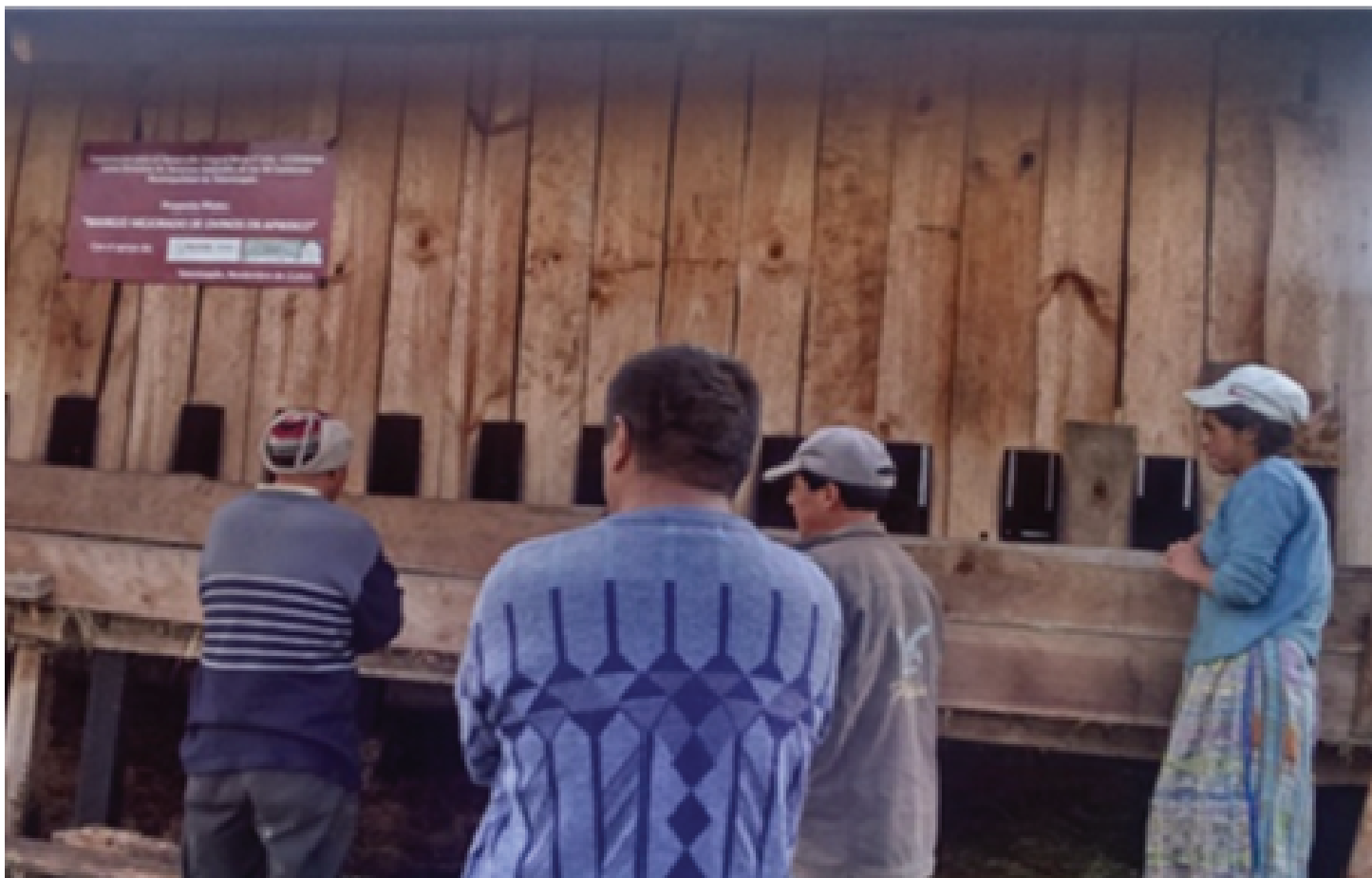
Vista exterior de un aprisco para la estabulación de ovejas en la Comunidad de Pacapox.