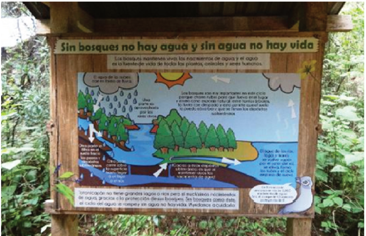
Rotulación en sendero del Parque Ecológico “Chajil Siwan”.