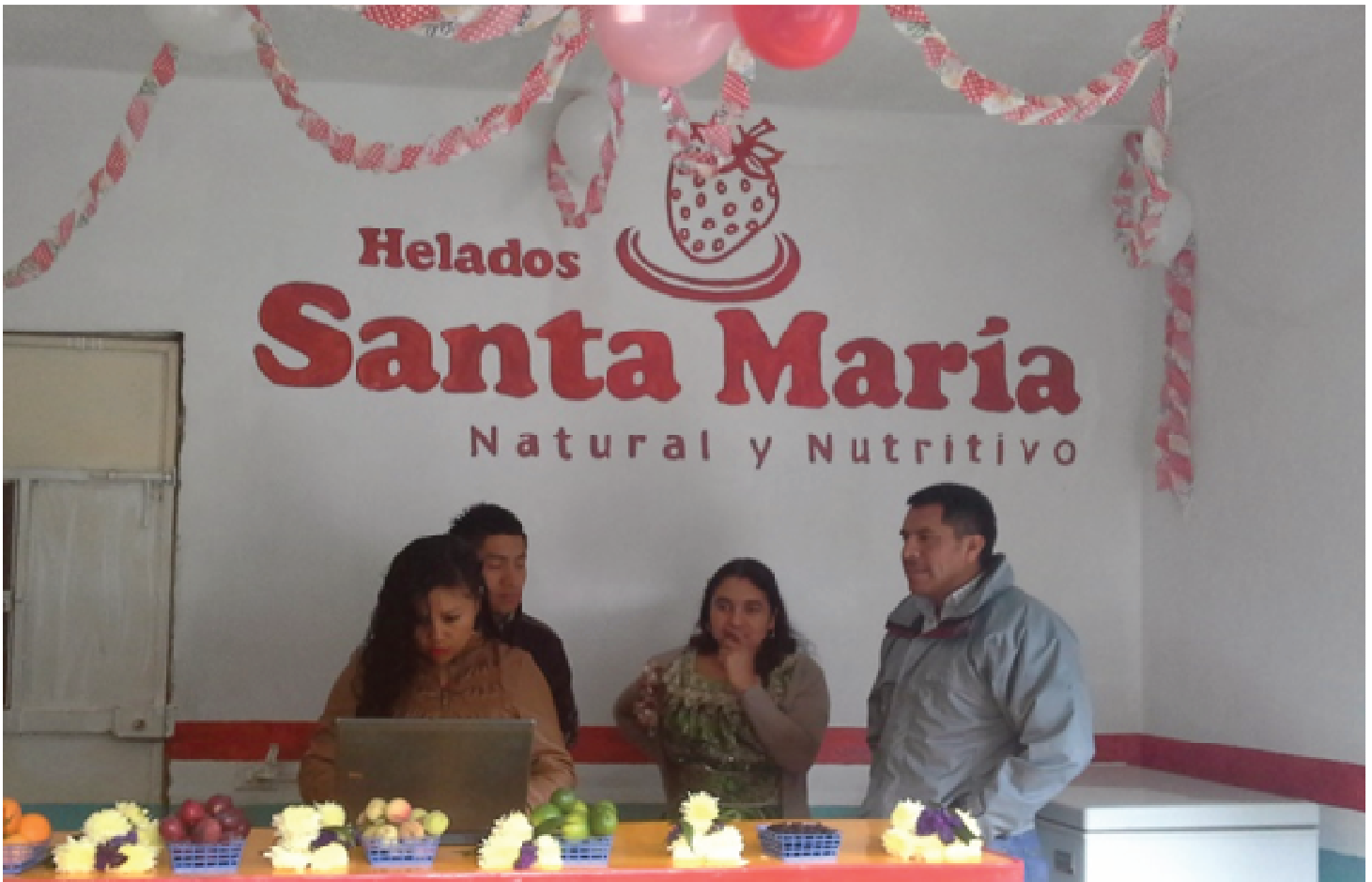
Tienda para la Venta de "Helados Santa María" en el municipio de Santa María Chiquimula.