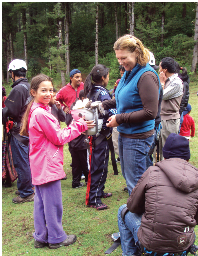
Turistas extranjeras disfrutando del Canopy en el Parque Ecológico "Chajil Siwan".

La organización se esfuerza por un mantener un manejo administrativo responsable y transparente. En términos ambientales, la sostenibilidad se refleja en que el bosque ha mejorado su condición ecológica.