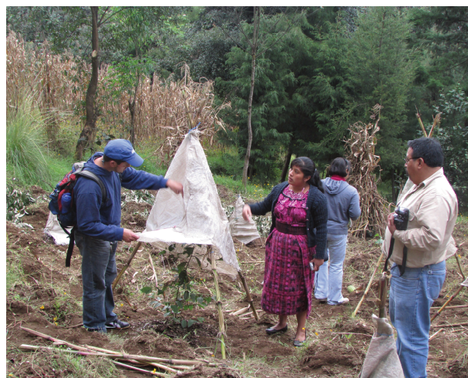
..... Capacitación para la construcción de estructuras para la protección de árboles contra heladas en el municipio de San Miguel Sigüilá, Quetzaltenango. .....

Dentro de las actividades de seguimiento, los grupos de mujeres plantean la implementación de proyectos pecuarios con el objetivo de dinamizar la economía del municipio.