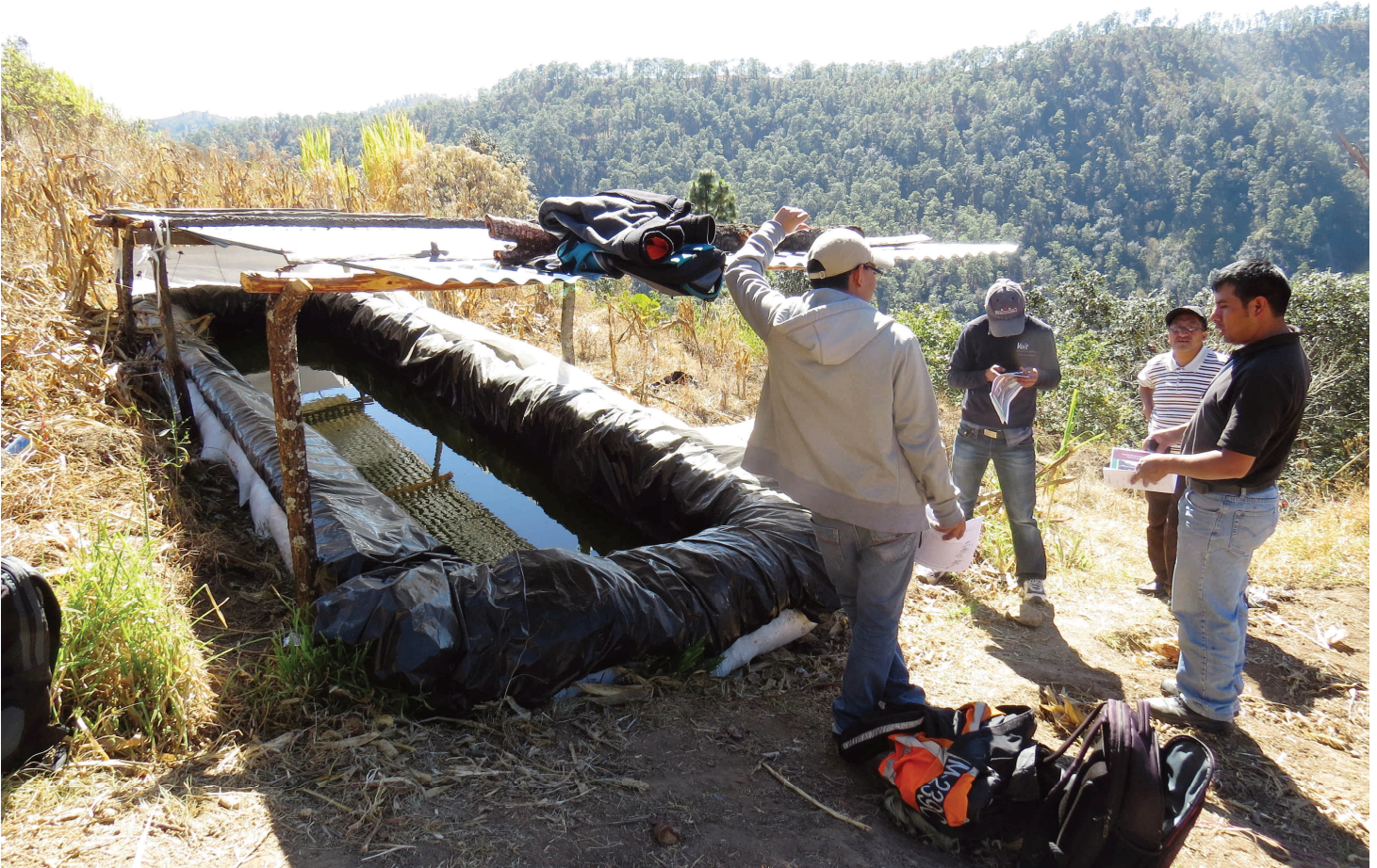
Capacitación para la construcción de aljibes con personal técnico del Ministerio de Agricultura, Ganadería y Alimentación en el municipio de Santa María Chiquimula, Totonicapán.