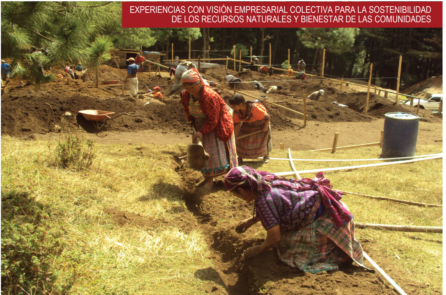
Actividades con participación activa y efectiva de actores locales con visión empresarial en base a “Consulta, diálogo, consensos y con administración: Transparente y rendición de cuentas”.