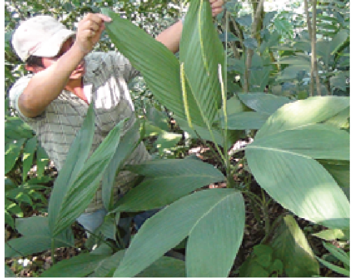
Productor tradicional de pacaína de la comunidad de Loma Linda conociendo el cultivo de Xate Cola de Pescado en la visita a plantaciones de Xate en Petén.

Se espera que en dos años a partir del establecimiento de las plantaciones, las hojas sean comercializadas y el proyecto sea sostenible. Las plantaciones son manejadas a nivel familiar, costo que es aportado por los comunitarios.